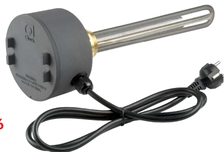
Protezione antideflagrante. / Anti-flare protection